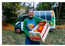
Street Food en Mouvement