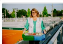
Le Chaînon manquant