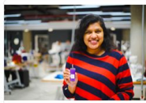
H.A.W.A au Féminin